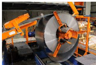
材料特性のノイズ

AutoForm-Sigmaでは、プレス成形工程に特有の加工バラツキや加工状態の変化を考慮できるため、製造現場の状態をより現実的に反映させることができます。本ソフトウェアを使って、プレス成形工程のロバスト性に対するノイズやバラツキの影響を定量化・予測できます。安定した信頼できる工程を実現するため、エンジニアは適切な是正対策を選択できます。