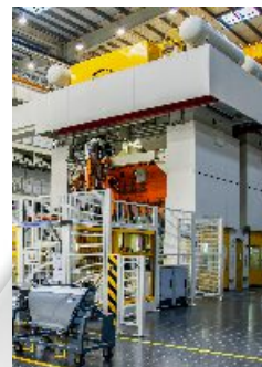
成形工程 パラメータのノイズ